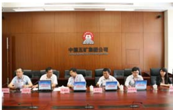
公司通过网络召开投资者说明会