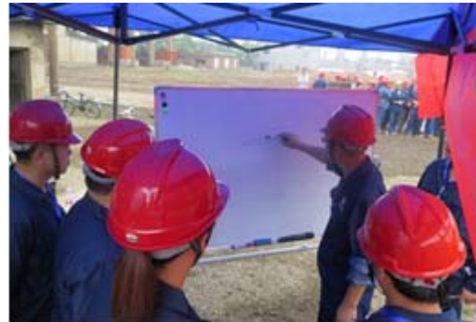
环保应急演练现场指挥