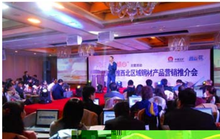
第十届“十领心”主题推广活动