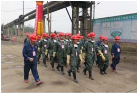
五矿湖铁含铬废水突发事件应急演练