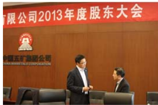
公司董事长与投资者进行现场交流