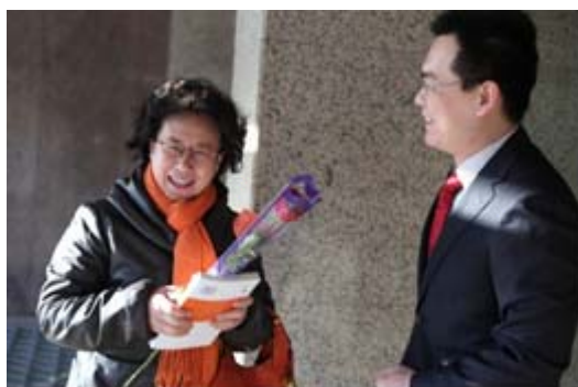
“三·八”妇女节公司慰问女员工